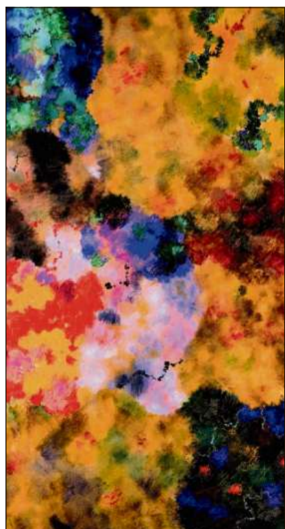
Augusto Giacometti: Erinnerung an die italienische Primitive II, 1927.

Giacometti pictura in maletg decorativ d'in mailer pumpus plain fritgs cotschens e verds. Sin il prà lontan ensuleglia spassegia ina dunna. Il format quadrat dal maletg n'è betg usità per Giacometti e tschiffa il tema dal maletg plitost sco model en la surfatscha. Ensem cun ses ami-artist Cuno Amiet represchenta Giacometti in colorissem tipic svizzer. Cuminaivlamain èn els s'occupads da las tendenzas da l'art franzos ed